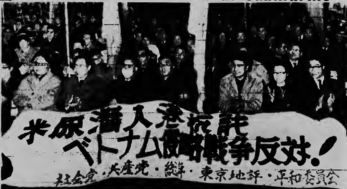
Un multitud di trahadornan y estudiantenan izquierdista antayera tabata asisti na un motin pa protesta contra bishita di e submarino nuclear Sculpin na Yokosuka, 50 milla zuidwest di Tokyo. Como 12,000 persona a asisti na e mitin. Dia 27 Sculpin lo bandona Yokosuka cu destino desconoci.